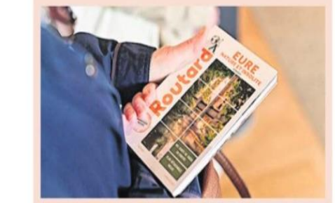
Le Guide du Routard de l'Eure est sorti le 20 avril.