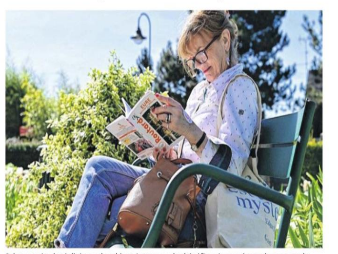
Selon une étude réalisée par le cabinet Asteres sur les bénéfices économiques du partage de logement sur la plateforme, l'Eure intègre le top cinq des destinations rurales ayant connu la plus forte croissance de revenus des hôtes en 2021 par rapport à 2019.

Airbnb, plateforme mondiale connue de locations d'hébergement, vient de dévoiler les résultats d'une étude selon laquelle l'Eure figure dans le top 5 des destinations rurales ayant connu les plus fortes croissances de revenus des hôtes en 2021 (par rapport à 2019). « Cocorico ! S'il fallait prouver une fois encore que dans l'Eure, tout est meilleur, la plateforme Airbnb, dévoile une étude en ce sens », se félicite le Département. Selon une étude réalisée par le cabinet Asteres sur les bénéfices économiques du partage de logement sur la plateforme, l'Eure intègre le top cinq des destinations rurales ayant connu la plus forte croissance de revenus des hôtes en 2021 par rapport à 2019. Juste derrière des destinations rurales touristiques comme le Jura, les Landes et l'Ardeche.