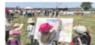
À Berville, les animations pour les enfants ne manquent pas.