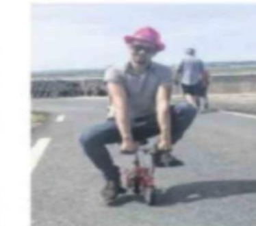
Des vélos pour tous les usages