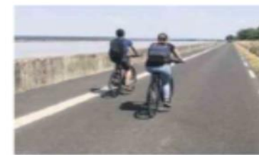
7 km de voie verte séparent désormais Honfleur à Berville.

La Seine à vélo a été inaugurée en grande pompe dans sa portion entre Honfleur et Ber-ville-sur-Mer. Les festivités se sont poursuivies à Berville, avec Bords de Seine en folie. Opérationnelle depuis août 2020, la portion de voie verte créée entre Berville-sur-Mer et Honfleur a pu être inaugurée samedi dernier. À l'invitation de la communauté de communes du pays de Honfleur-Beuzeville, les partenaires de ce projet se sont réunis sous le pont de Normandie pour couper le ruban devant ce tronçon de 7 km d'enrobé réalisé sur les quais en Seine, propriété d'Haropa Port, qui fait partie intégrante de la Seine à Vélo, ce tracé qui relie Paris à la Normandie. Le président du département du Calvados, Jean-Léonce Dupont était présent, de même que le sénateur de l'Eure, Hervé Maurey, au milieu des élus locaux qui se sont tous félicités de cette réalisation dont le coût avoisine 1,3 million d'euros. Quelque 70 habitants du territoire étaient aussi réunis pour participer à un départ groupé à vélo direction Berville où l'office de tourisme et le comité des fêtes de Berville avaient concocté un programme d'animation des plus réjouissants pour la fête « Bords de Seine en folie » qui a fait la part belle à la petite reine.