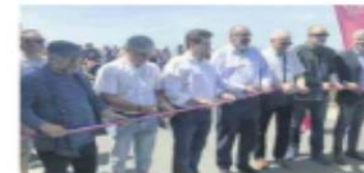
Les élus coupent le ruban inaugural.